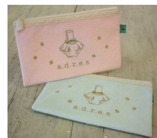
オリジナルポーチ