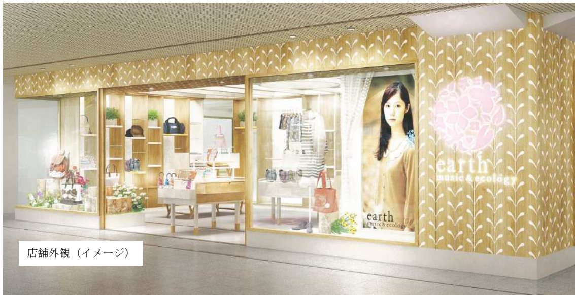
店舗外観（イメージ）

手に取りやすい雑貨を充実させるなど、駅ならではの商品構成でお客様をお迎えします。